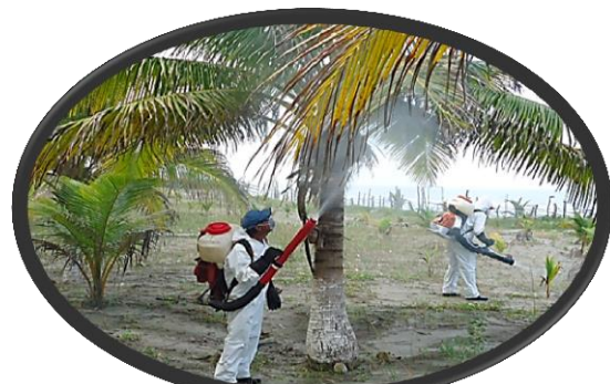
Control de focos de infestación