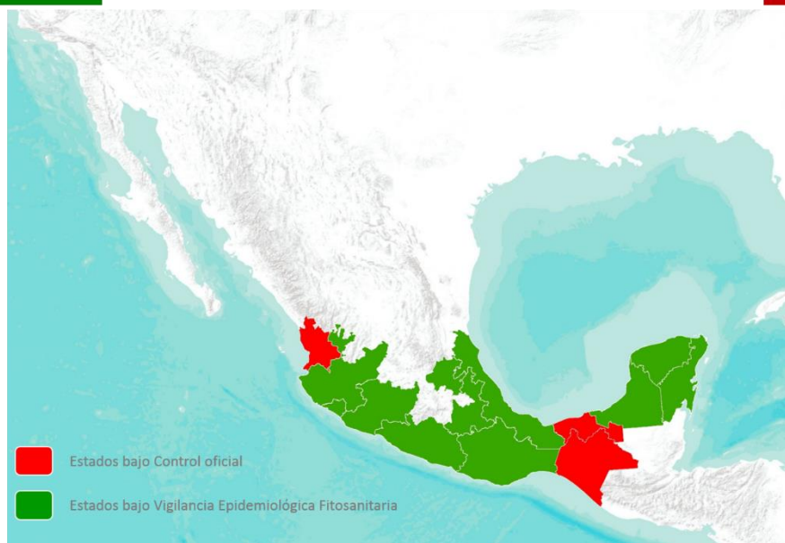
Figura 2. Estados donde se realiza actualmente la vigilancia de Ralstonia solanacearum Raza 2 en México. Elaboración propia con datos de SAGARPA-SENASICA-PVEF, 2016b.